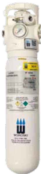
2 l komposiittiturvapullo (uusi valkoinen pulloväri ja uusi Viproxy-venttiili)

Laskelmissa on käytetty kaavaa (paine X tilavuus)/virtaus. Tulokset on pyöristetty alaspäin. Laskelmissa ei ole otettu huomioon virtaustarkkuutta.