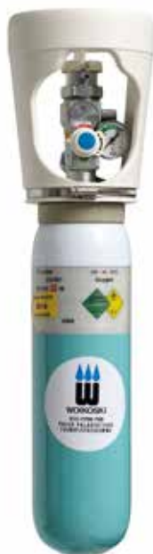
2 l komposiittiturvapullo