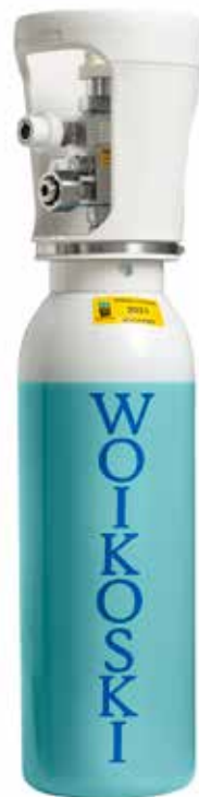
5 l turvapullo