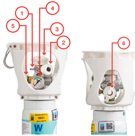
Kuva 2. Viproxy-venttiili