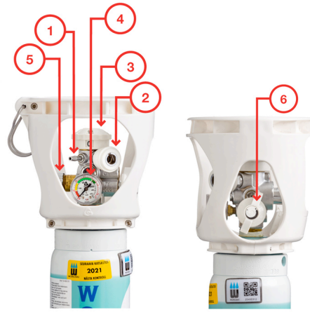
Bild 2. Viproxy ventil