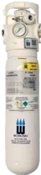
2 l komposiittiturvapullo (uusi valkoinen pulloväri ja uusi Viproxy-venttiili)

Laskelmissa on käytetty kaavaa (paine X tilavuus)/virtaus. Tulokset on pyöristetty alaspäin. Laskelmissa ei ole otettu huomioon virtaustarkkuutta.