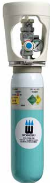
2 l komposiittiturvapullo